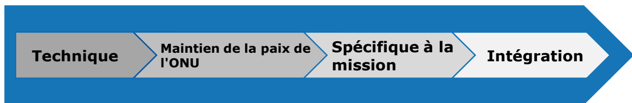
Diagramme 5 : Étapes au cours des phases de la formation préalable au déploiement

La responsabilité nationale et de l'ONU pour la formation préalable au déploiement couvre quatre étapes importantes.