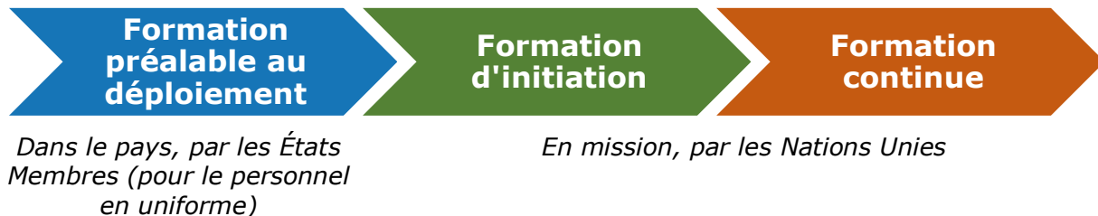
Diagramme 4 : Les phases de la formation au maintien de la paix

La formation au maintien de la paix comporte trois phases. Le lieu et l'entité responsable de cette formation diffèrent selon les phases. Les normes définissent ce que les apprenants doivent apprendre et ce que les formateurs doivent enseigner.