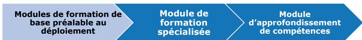
Diagramme 6 : Exigences obligatoires et recommandées de l'ONU en matière de formation au maintien de la paix

Les MFBPD sont universels et présentent les connaissances essentielles pour tout personnel de maintien de la paix (militaire, civil et police) avant le déploiement. Ces modules incluent la formation sur la conduite et la discipline et la prévention de l'exploitation et des abus sexuels. Les MFBPD s'appliquent à toutes les fonctions, catégories et grades. Les MFBPD établissent également des exigences minimales en matière de processus pour dispenser une formation préalable au déploiement conforme aux normes de l'ONU.