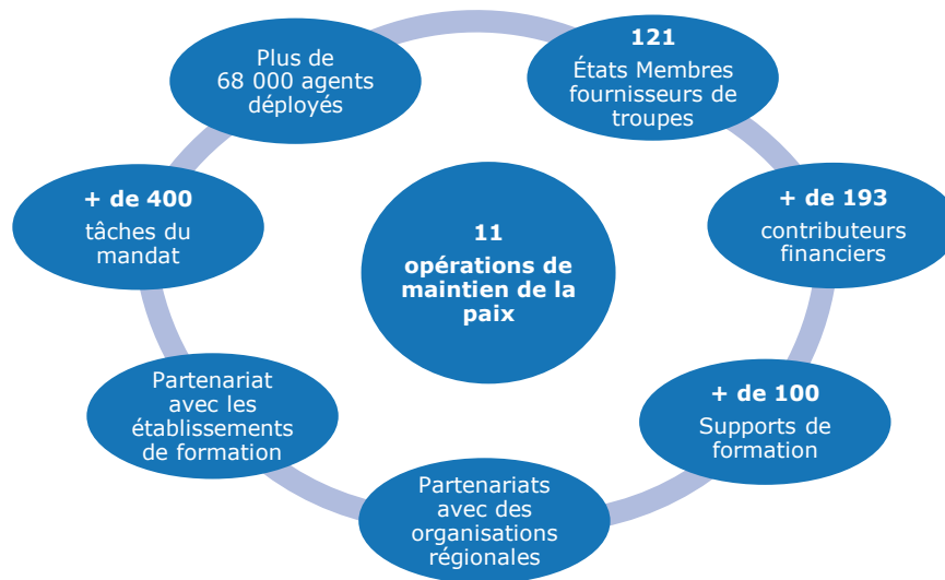
Diagramme 3 : Formation – Un défi d'envergure

L'ampleur et la diversité des acteurs qui ont besoin d'un appui posent un défi à la formation au maintien de la paix de l'ONU.